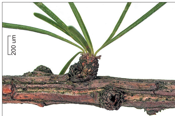
Рис. 1. Многолетний побег Larix olgensis A. Henry.

Программный комплекс “Taxon.pro”. Описание структуры компьютерной системы. В ходе разработки программного комплекса мы опирались на материалы последних 50 лет по применению информационных технологий в биодиагностике. Также нами был использован опыт составления печатных цифровых политомиических ключей (Балковский, 1964; Кискин и др., 1965; Бородина и др., 1966). В указанных работах особое внимание уделялось методике построения многовходовых ключей. Подобный тип ключей позволяет определять таксон в разных комбинациях признаков и при любом порядке выбора установленных значений признаков.