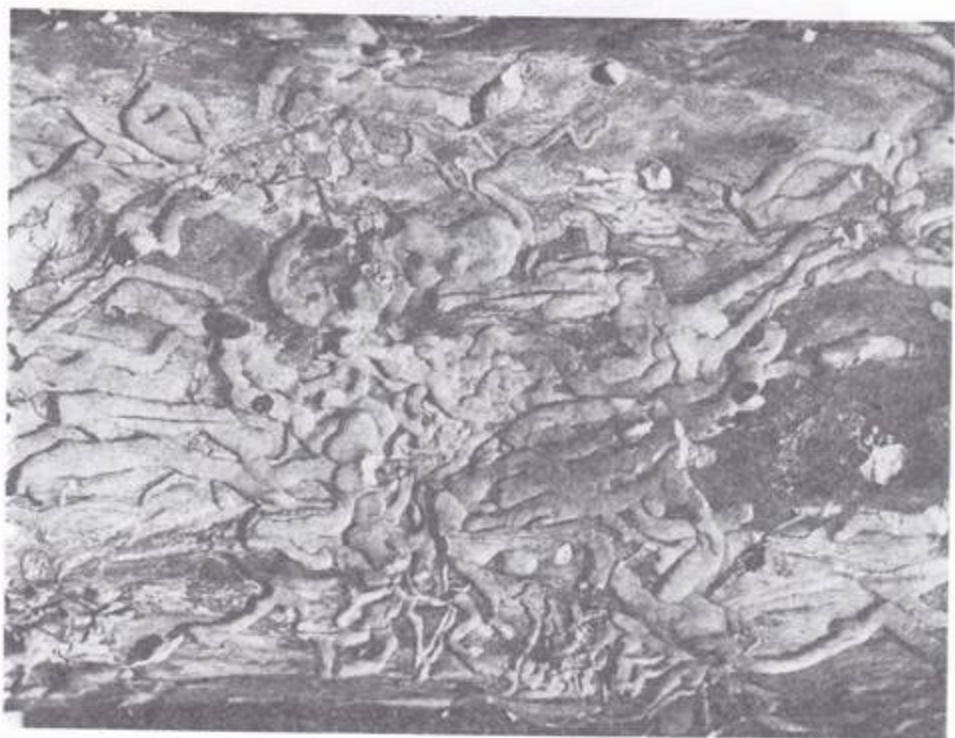
Fot. 4. Chodniki larw X. capricornis (GEBL.) po odlupaniu kory.

Samice składają jaja do szczelin kory lub drewna. Po około 14 dniach (w hodowlach laboratoryjnych po 7-10 dniach) lęgną się larwy, które żerują krótko pod korą (chodnik 20-90 mm długości) (Fot. 4), a następnie wgrzyżają się do drewna, gdzie kontynuują żer. Larwy wgrzyżają się do drewna stosunkowo głęboko, w przypadku zasiedlonego drzewa o grubości 12-15 cm - aż do samego środka (Fot. 5). Chodniki, szerokości 8-12 mm, zapychają za sobą trocinkami. Jesienią następnego roku po złożeniu jaj, rzadziej dopiero na wiosnę, larwy budują w drewnie kolebki poczwarkowe na głębokości 3-55 mm. Bardzo rzadko kolebka poczwarkowa znajduje się między korą a drewnem (około 1-2% przypadków). Nieco częściej larwy przepoczwarczają się nie w kolebce poczwarkowej, ale w chodniku wyjściowym (około 1-4% przypadków). Wygryzionymi wiórkami larwy zwykle zatykają otwory wylotowe, gdy zasiedlone drzewo pokryte jest cienką korą. W przypadku gdy drzewo posiada grubą korę (w dolnych częściach starszych drzew) larwy wygryżają