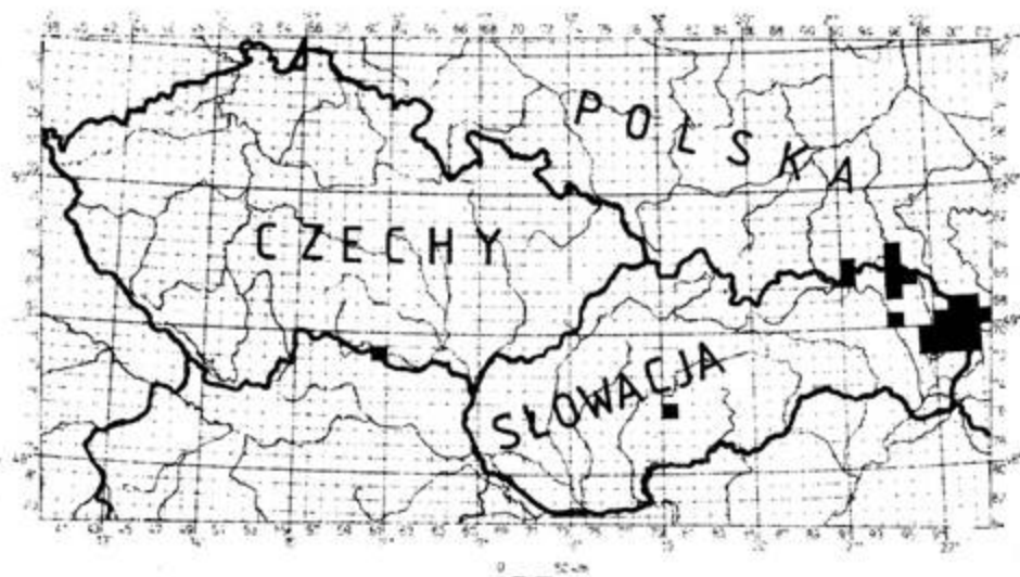
Ryc. Rozmieszczenie X. capricornis (GEBL.) w Polsce, w Czechach i na Słowacji.

Fig. Geographical distribution of X. capricornis (GEBL.) in Poland, Czech Republic and Slovakia.