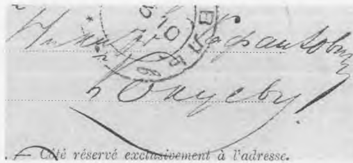
Рис. 5. Фрагмент написания адреса на Открытом письме (крупно)