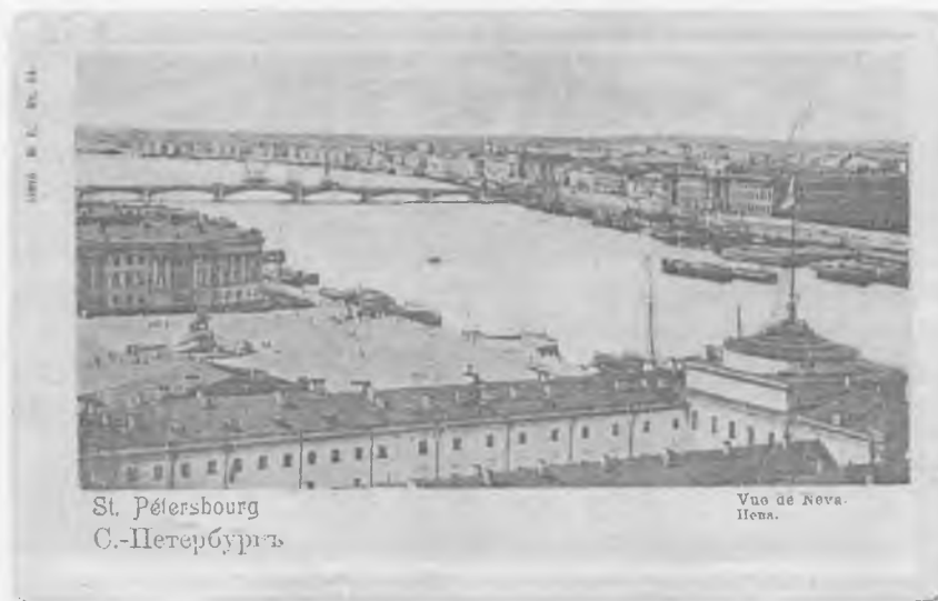
Рис. 1. Открытое письмо Н. Р. Кокуеву

Иллюстрации к статье Д. В. Власова. Атрибуция авторства Открытого письма из собрания Ярославского музея-заповедника