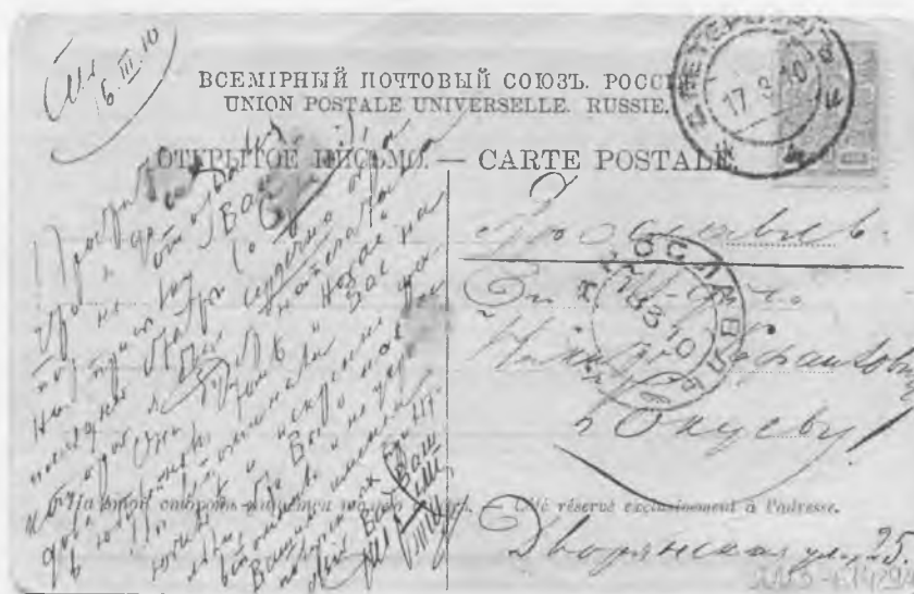
Рис. 2. Открытое письмо Н. Р. Кокуеву (оборот)