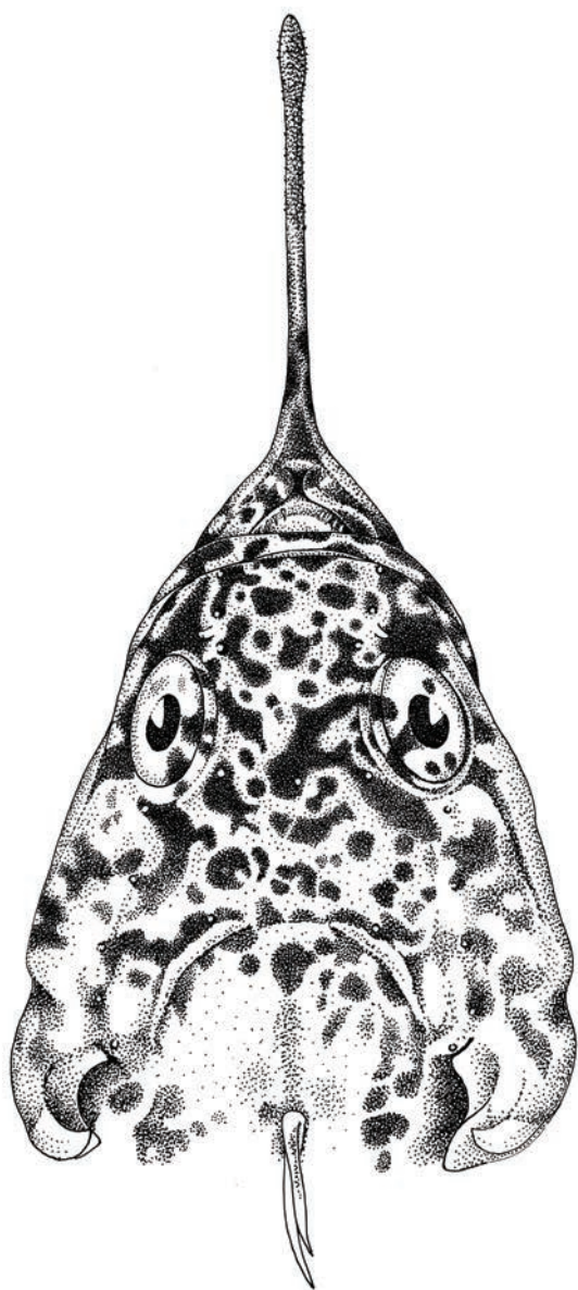
Рис. 2. Плетеусая бородатка Pogonophryne sarmentifera sp. nov. Голотип. Вид головы сверху.

Fig. 2. Pogonophryne sarmentifera sp. nov. Holotype. Dorsal view of the head.