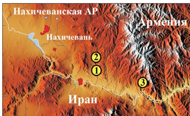
Рис. 2. Точки находок стрелы-змеи ( Psammophis lineolatus ) на Кавказе: 1 – окрестности с. Кярим-Кули-Диза (ЗИН РАН № 17008; Даревский, 1959), 2 – 4 км севернее с. Диза (= Кярим-Кули-Диза) (ЗМ ННПМ НАН Украины № 84/430; Доценко, 2003), 3 – район с. Анабад (ЗИН РАН № 29095)

земляра были найдены в Нахичеванской котловине. В целом ареал P. lineolatus в регионе ограничен областью Приараксинских хребтов и котловин Армянского вулканического нагорья, которое по классификации Н. В. Думитрашко (1966) входит в Переднеазиатское нагорье.