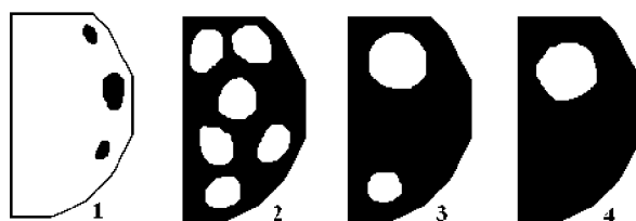
Рис. 1. Основные типы окраски надкрылий H. Axyridis ; 1 – succinea , 2, – axyridis , 3 – spectabilis , 4 – conspicua

Нами проведена сравнительная оценка фенотипической структуры популяций кокцинеллиды Harmonia axyridis Pall. по двум признакам: рисунку надкрылий и наличию элитрального гребня. Рисунок надкрылий определяется серией множественных аллелей одного локуса [23]. Рисунок надкрылий составляют серию переходов от светлых (желтых или красных) форм до черных с одним или двумя светлыми пятнами на надкрыльях. Наиболее распространены 4 аллели: succinea , axyridis , spectabilis и conspicua (рис. 1). Аллели образуют ряд кодоминирования: conspicua > spectabilis > axyridis > succinea . Морфотип succinea рецессивен по отношению ко всем остальным формам.