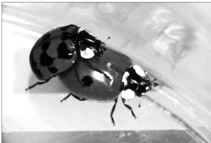
Рис.3. Спаривание красных адалий с различным рисунком на надкрыльях.

Помимо этого был получен еще один интересный результат. Мы изучили образование пар не только в Ялте, но и в Севастополе, где черных жуков в популяции значительно меньше — 25%. Оказалось, что в обоих городах наиболее часто спариваются жуки более редкой окраски: в Ялте — красные, в Севастополе — черные. Иными словами, более редкая для данного сообщества внешность пользуется большим успехом.