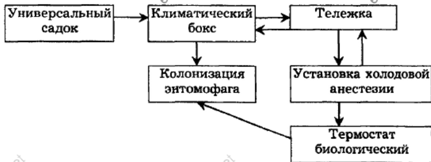
Рис. 3. Принципиальная схема производства криптолемуса.

Оборудование для промышленного производства криптолемуса было создано и смонтировано на базе Лазаревской ОСЗР. Его мощность составляет 5 млн. особей в год. В комплект оборудования вошли: садки универсальные (420 шт.), климатические боксы (10 шт.), установка холодной анестезии, тележка, термостат биологический, щит управления, установка для криоконсервации яиц систотроги (рис. 3).