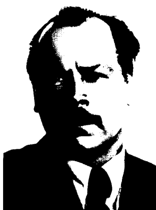
Фото 4. Н.И. Вавилов (1887–1943)