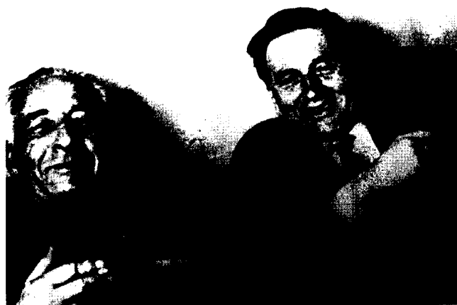
Фото 11. Н.В. Тимофеев-Ресовский (1900–1981) и М.Е. Лобашев (1907–1971) на кафедре генетики и селекции Ленинградского университета. 1960-е гг.

Позже, вскоре после возвращения с фронта (в 1946 г.) Лобашев защищает докторскую диссертацию, в которой формулирует физиологическую теорию мутационного процесса. Согласно этой теории мутация — не результат непосредственного изменения гена при попадании в него ионизирующей частицы или кванта энергии, а результат нетождественного восстановления — репарации клетки (генетического материала) после их повреждения [16]. Впервые в мировой науке М.Е. Лобашев поставил рядом два понятия: мутация и репарация. Мировая наука пришла к этому лишь в 60-е гг. XX в., и теперь связь репарации и мутационного процесса общепризнана [36]. Увы, это признание произошло уже без участия автора физиологической гипотезы. В наши дни механизмы возникновения мутаций связывают именно с многочисленными системами репарации ДНК в клетке. Справедливость требует напомнить, что М.Е. Лобашев говорил о денатурации