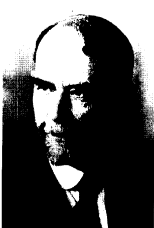
Фото 6. Т.Х. Морган (1866–1945)

Меллер опубликовал свое открытие в 1927 г. «Четыре страницы, которые взволновали ученый мир» — так назвал свой комментарий об этой работе в «Правде» 11 сентября 1927 г. А.С. Серебровский [6], сотрудник Н.К. Кольцова, основавший в 1930 г. кафедру генетики Московского университета. Меллер (после неудавшейся попытки самоубийства [20]) приехал в СССР через Германию, где он встретился с Н.В. Тимофеевым-Ресовским. По совету Тимофеева-Ресовского Меллер отправился в Институт генетики к Н.И. Вавилову и на кафедру генетики к Г.Д. Карпеченко, где он в дальнейшем преподавал генетический анализ дрозофилы. Эти лекции, как и многие другие, слушали вместе студенты обеих кафедр генетики Ленинградского университета. Лучшего специалиста по конструированию генетических линий дрозофилы в то время не существовало. Меллера можно назвать первым хро-