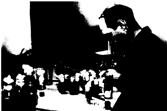
Фото 9. Г.Дж. Меллер (1890–1967). 1930-е гг.

этой же работе 1935 г. впервые был оценен размер гена как макромолекулы [см. также 10]. Мутация рассматривалась как качественный переход макромолекулы гена в новое состояние в результате непосредственного действия ионизирующего излучения на ген.