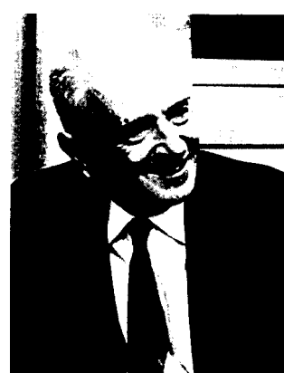
Фото 8. Ф.Г. Добжанский 1970-е гг. 2