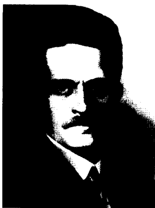
Фото 3. Ю.А. Филипченко (1882–1930)