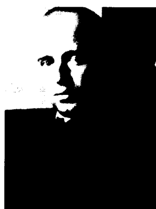
Фото 7. Ф.Г. Добжанский (1900–1975) 1