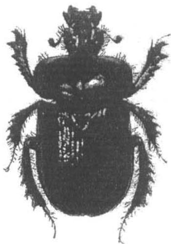
Рис. 1. Ceratophyus kabaki Nikolajev, sp. n.