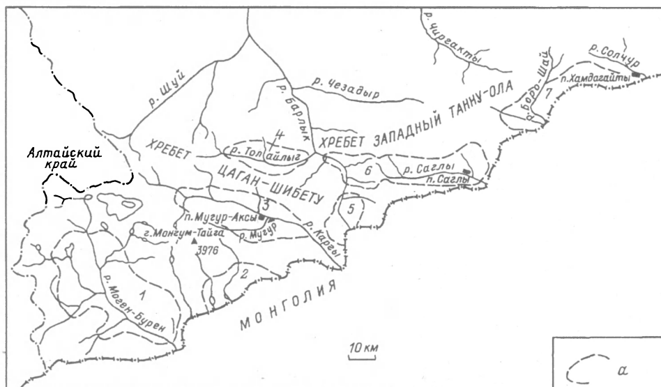
Рис. 2. Распределение популяций длиннохвостого суслика Citellus undulatus в Юго-Западной Туве.

a — границы отдельных популяций длиннохвостого суслика; популяции: 1 — могоен-буренская; 2 — кара-бельдырская; 3 — каргинская; 4 — толайлыгская; 5 — верхнебарлыкская; 6 — саглинско-барлыкская; 7 — боро-шайская.