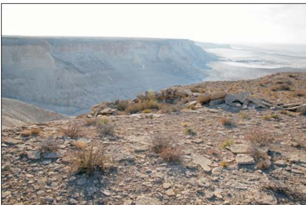
Рис. 4. Место обитания Spalerosophis diadema. Западный чинк Уstyурта 10.10.2016 г. (точка 5 на рис. 1).