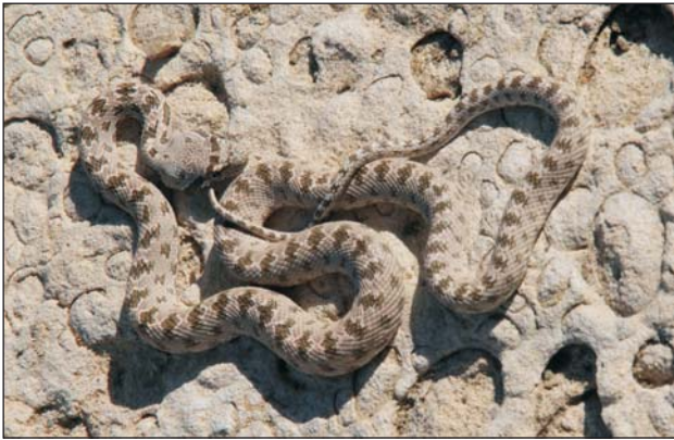
Рис. 3. Ювенильный экземпляр Spalerosophis diadema, обнаруженный на Западном чинке Уstyурта на территории Уstyуртского ГПЗ 21.09.2017 г. (точка 8 на рис. 1).

что территория заповедника включает в себя южную оконечность Западного чинка Уstyурта на протяжении более 120 км, так и с большей степенью её изученности. Во всех случаях змеи были обнаружены на колониях песчанок или поблизости от них.