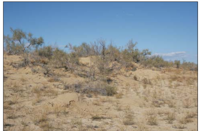
Рис. 5. Место обитания Spalerosophis diadema. Пески Карынжарык вблизи границы Уstyуртского ГПЗ (точка 4 на рис. 1) 12.09.2016 г.

На территории РК S. diadema имеет тот же статус, что и желтобрюхий – Hierophis caspius (Gmelin, 1789) и Палласов – Elaphe sauromates (Pallas, 1811) полозы, включенные в Красную книгу РК (2010): все три вида встречаются здесь на границе своего обширного ареала на ограниченной территории, однако количество находок чешуелобого полоза в Казахстане несопоставимо меньше чем E. sauromates и сопоставимо с количеством находок H. caspius . На основании этого считаем необходимым включить S. diadema в «Красную книгу РК» в категории III – малоизученный вид, встречающийся на ограниченной территории.