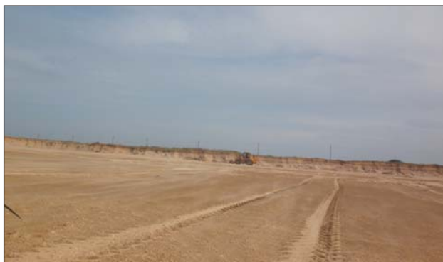
Рис. 1. Разрушенные местообитания Testudo graeca на побережье Каспийского моря в окрестностях озёр Малое и Большое Турали

На рубеже XX – XXI вв. черепаха в этой части ареала обитала на полупустынно-степных ландшафтах и в тугайных зарослях вдоль побережья Каспия. Площадь местообитаний составляла 2520 га, а средняя плотность – 0.1 особ./га (Leontyeva et al., 1998; Mazanaeva, 2001). За весь период исследования на этой территории нами были найдены всего три половозрелые особи: одна – в прибрежной полосе тугайных зарослей, другая – в котловане, оставшемся после вывоза песка и грунта, третья – в окопе, по-видимому, образовавшемся после учений расположенной вблизи по-