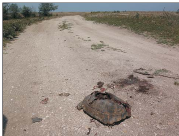
Рис. 2. Testudo graeca , погибшая на дороге к Каспийскому морю (окрестности пос. Зеленоморск)

Несколько южнее средиземноморская черепаха в середине XX в. была довольно обычна на побережье Каспия между пос. Манаскент и г. Избербаш (Банников, 1951; Спасская, 1985). Она обитала на песчаном побережье, а также на полупустынно-степных ландшафтах первой и второй древнекаспийских террас. Площадь местообитаний составляла около 3870 га. В 1960 – 1970-х гг. началось активное хозяйственное и рекреационное освоение этой части низменности. К концу XX в. почти всё побережье оказалось застроенным под зоны отдыха, а прилегающая территория трансформирована в агроландшафты (виноградники и овощные поля). Разрозненные группировки черепахи все ещё встречались на агроландшафтах, а также на сохранившихся участках с естественными растительными формациями в пределах деградирующих биотопов. Плотность составляла 0.15 – 0.6 особ./га и значительная часть обнаруженных особей была травмирована (Mazanaeva,