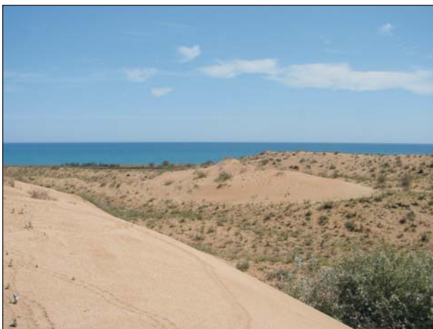
Рис. 3. Местообитания Testudo graeca между Каспийским морем и оз. Аджи

Плотность черепахи в местах скопления в пересчете составляла 8 – 11 особ./га (Банников, 1951). В 1980 – 1990-х гг. в связи с активным заселением и хозяйственным освоением этой части низменности численность местами сократилась более чем в 10 раз (Банников, 1984; Спасская,