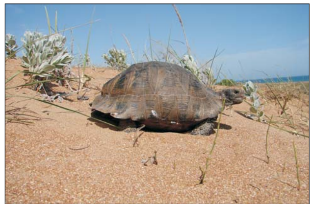
Рис. 4. Самка Testudo graeca на прибрежных бугристых песках в окрестностях оз. Аджи

Fig. 4. A Testudo graeca female on the coastal hilly sands in the vicinity of the Aji Lake