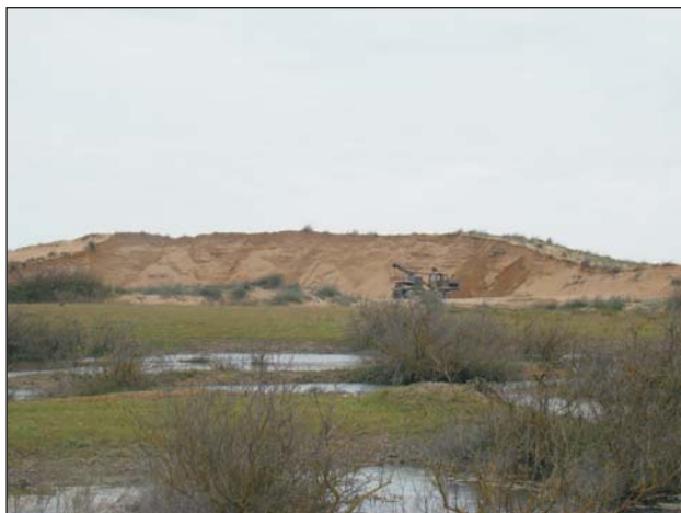
Рис. 5. Разрушение местообитаний Testudo graeca в окрестностях оз. Аджи